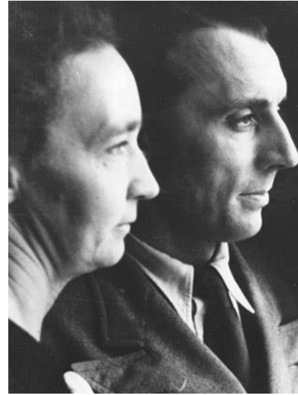
I & F JOLIOT-CURIE