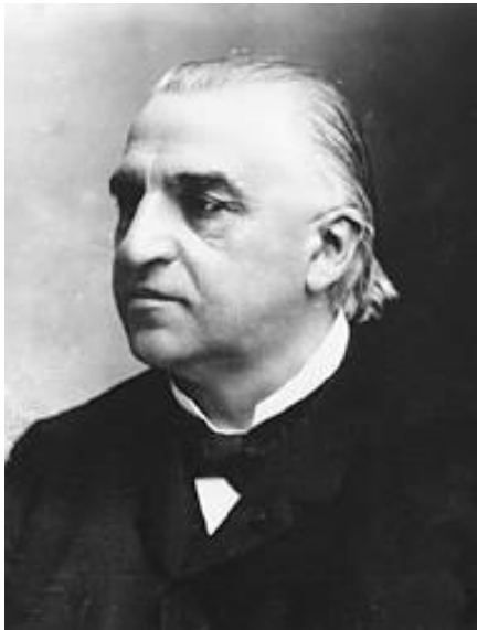
J. M. CHARCOT